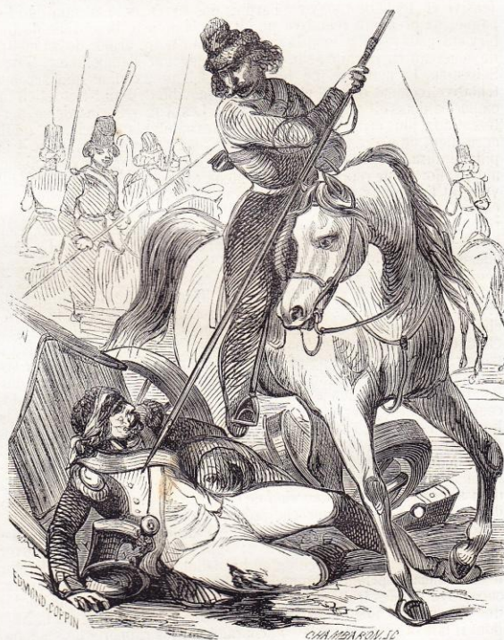
Cosaques massacrant les prisonniers français. Page 447.

en pleine déroute et ne se rallia que sous la protection des remparts de Pampelune. — Il faut le reconnaître, cette déroute fut due à une série de fautes dont la plus grave fut d'avoir accepté le combat, privé de quinze mille hommes, commandés par le général Clausel, qui firent leur rentrée en France sans coup ferir par la Navarre et Logrono, et des douze mille hommes commandés par le général Foy, qui après une lutte acharnée avec le corps du général anglais Thomas-Graham, à Tolosa, parvint à rentrer en France par Irun. Le corps de l'armée rallié sous Pampelune opéra son mouvement de retraite par les gorges de Roncevaux et la vallée du Bastan. Wellington commença immédiatement le siège de Saint-Sébastien et le blocus de Pampelune. Pendant ce temps les troupes françaises chargées de la défense de la Catalogne, de l'Aragon et du royaume de Valence, déployaient toujours cette constance et cette intrépidité dont elles avaient donné des