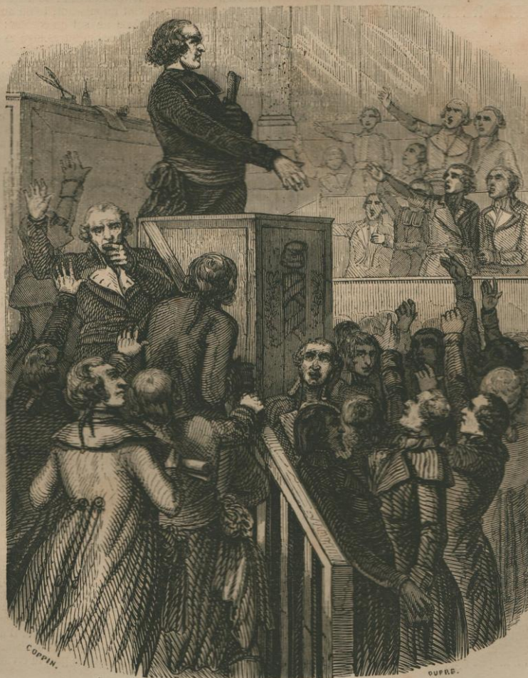
Proclamation de la République. Page 4.

Nos soixante dernières années composent en quelque sorte six grands siècles historiques, six phases importantes. — D'abord l'orage révolutionnaire s'amoncelle, il s'avance grondant, et éclate. puis la réaction triomphe, l'immoralité domine la société; ce fut comme une tentative de retour vers les voluptés faciles du règne de Louis XV; tout à coup le génie de l'ordre s'élève au-dessus des souvenirs de destruction de 1793, des galanteries du Directoire; — le Consulat et l'Empire — quatorze années de gloire, de succès inouïs, de déplorables revers; la liberté se voile, étouffée sous des monceaux de lauriers, l'Empire croule, le principe d'hérédité absolue, protégé par nos défaites, apparaît comme un fantôme aux